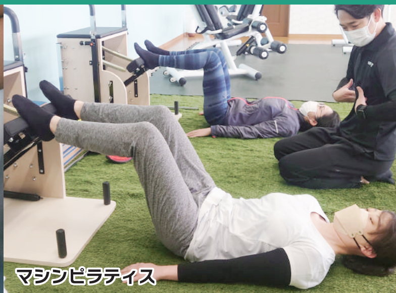
マシンピラティス